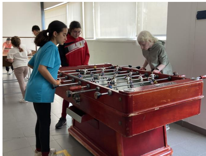
Pie de foto: Momento de ocio: alumnas jugando al fútbolín.

En el taller "El huerto ecológico", los participantes aprendieron cómo la innovación se une a la conciencia ambiental. Utilizando materiales reciclados, aprendieron técnicas para cultivar en espacios reducidos, minimizando su impacto ecológico. Guiados por maestros del CRE, crearon sistemas de riego por goteo que promueven el uso eficiente del agua y la salud de las plantas, además de aprender sobre el trasplante de esquejes, fomentando la regeneración vegetal. Este taller no solo proporcionó conocimientos sobre jardinería urbana, sino que también aumentó la conciencia sobre la conexión con la naturaleza y la responsabilidad de preservarla.