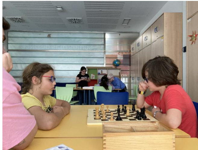
Pie de foto: Momento de ocio: alumnos jugando al ajedrez.