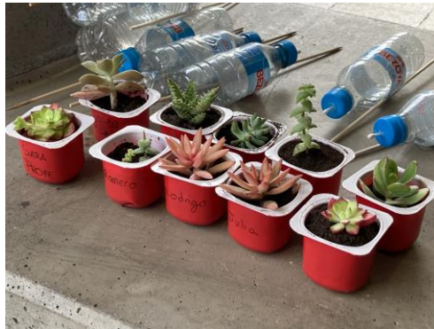
Pie de foto: trabajos realizados por los alumnos en el taller de huerto.