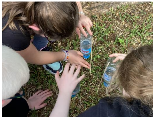
Pie de foto: alumnos comprobando el mecanismo manual que han elaborado para el riego por goteo.

En el taller de música, los estudiantes descubrieron cómo proteger el planeta a través del reciclaje, aprendiendo canciones que destacaban la importancia de las tres R: reducir, reciclar y reutilizar. Además, para poner en práctica lo aprendido, se realizaron dos instrumentos musicales con materiales reciclados: una flauta de pan con pajitas de cartón y un pito de carnaval, demostrando que la creatividad puede ser sostenible.