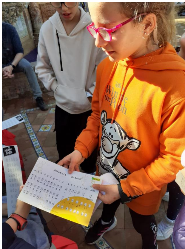
Ilustración 6. LES ENSEÑAMOS EL BRAILLE A NUESTRAS NUEVAS AMISTADES.