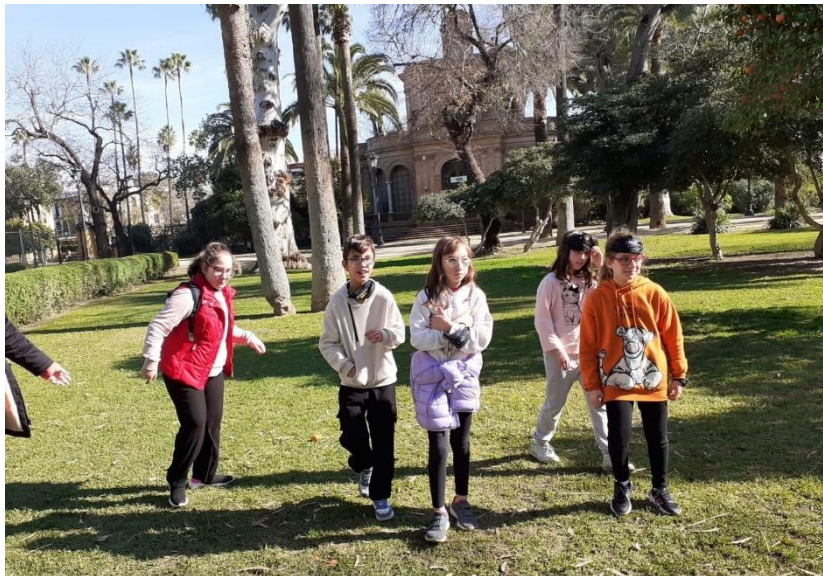
Ilustración 4. JUGANDO EN EL PARQUE.

Además, los Scouts trajeron al parque una tienda de campaña y nos enseñaron a montarla, desmontarla y guardarla. Fue muy divertido!