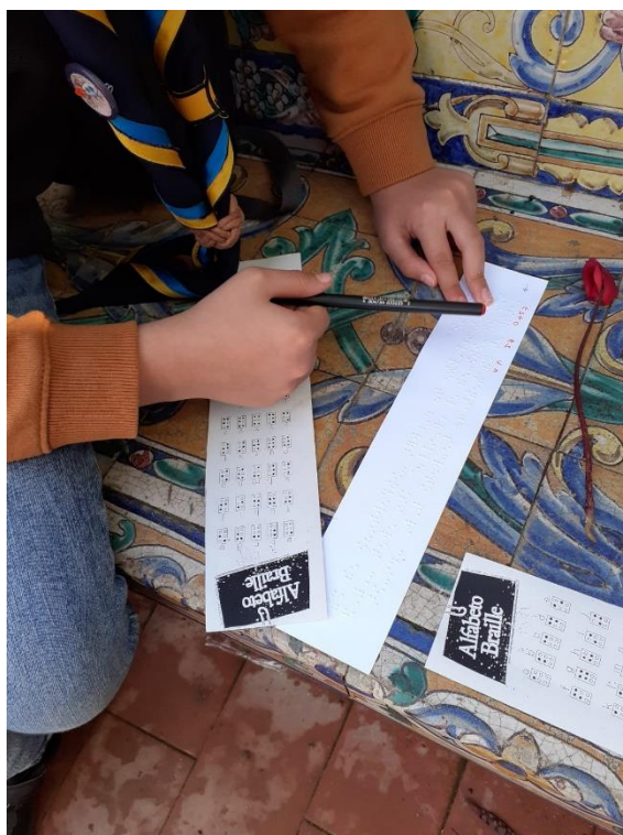
Ilustración 7. UN CHICO DEL GRUPO DE LOS SCOUTS DESCIFRANDO UN MENSAJE SECRETO ESCRITO EN BRAILLE

Después de relacionarnos y divertirnos en grande al aire libre afrontando asertivamente la diversidad, organizamos entre todos un estupendo picnic para compartir apetito y sensaciones.