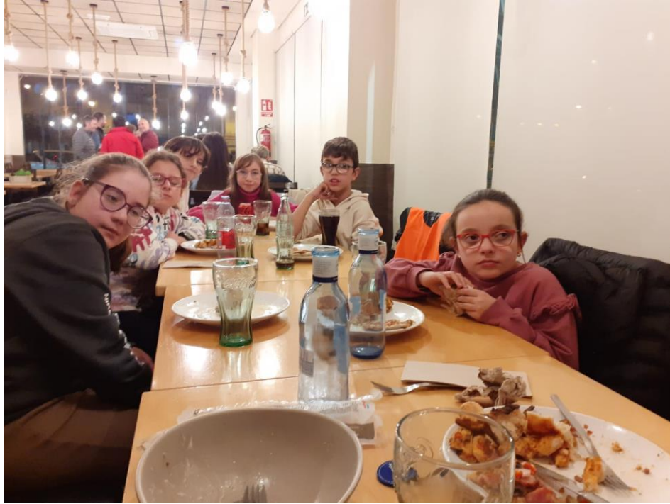
Ilustración 2. CENA EN LA PIZZERÍA

Después de un suculento desayuno competente, tipo buffet en el que los chicos y chicas se ayudaron como grupo en las pequeñas dificultades que aparecían, nos dirigimos al parque de M a Luisa, donde durante la mañana del sábado pasamos realizando actividades conjuntas con un grupo de scouts de la misma edad que nuestros chicos.