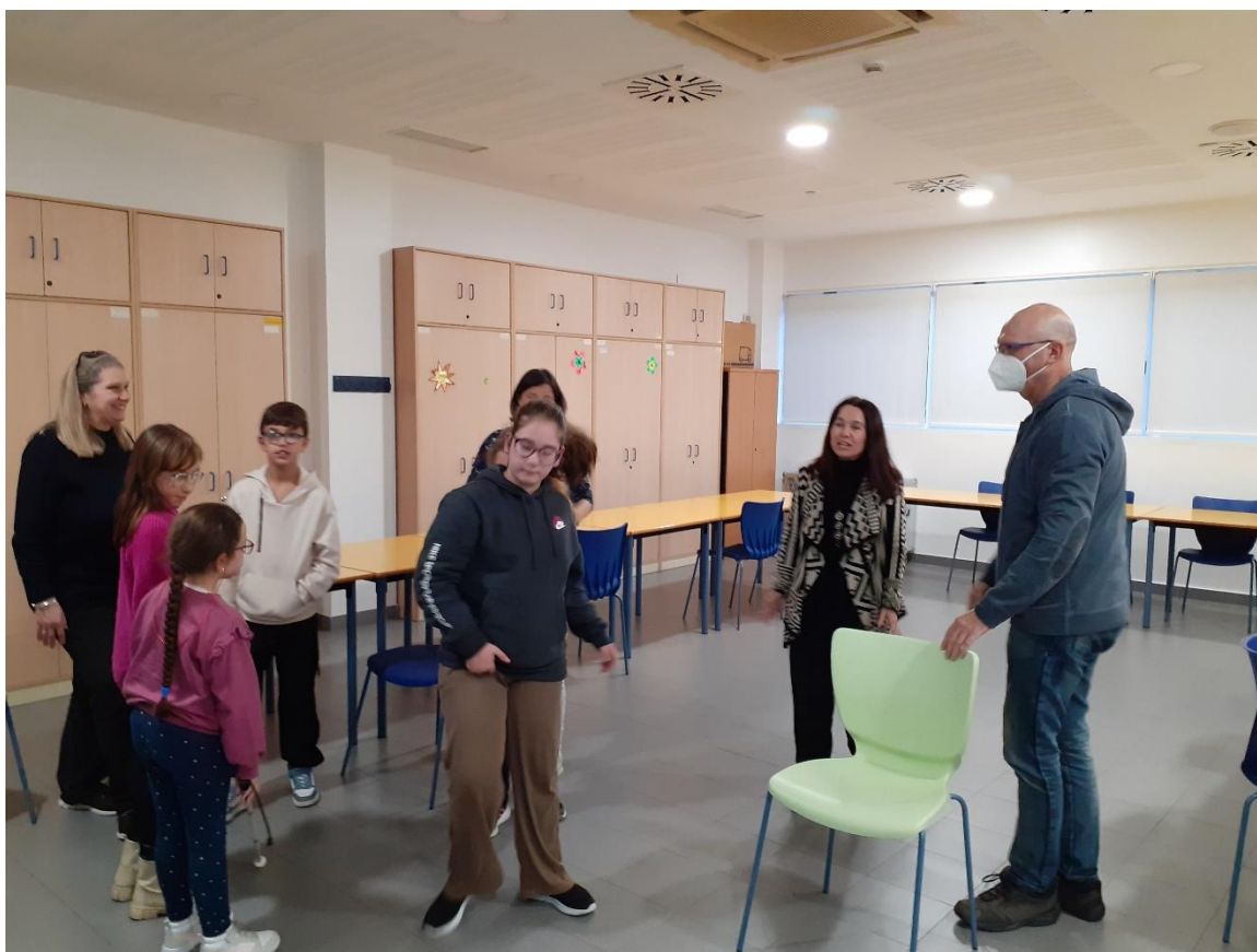
Ilustración 1. DINÁMICA DE PRESENTACIÓN DEL SEC

Durante el último fin de semana de este mes de enero, se ha celebrado en el CRE de Sevilla la primera parte del Servicio de Escolarización Combinada (SEC) de Competencia Social en el que seis chicos y chicas de las provincias de Cáceres, Badajoz, Córdoba y Cádiz, han tenido la ocasión de poner en juego, entrenando distintas habilidades y destrezas sociales, su autonomía en las relaciones con iguales. Los participantes pertenecen al grupo de educación primaria con edades comprendidas entre los 9 y 11 años.