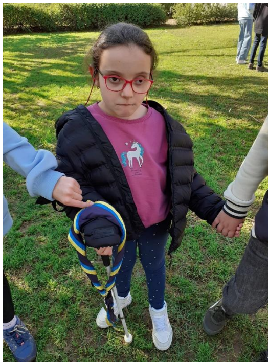
Ilustración 5. DOS SCOUTS JUGANDO CON UNA DE NUESTRAS ALUMNAS