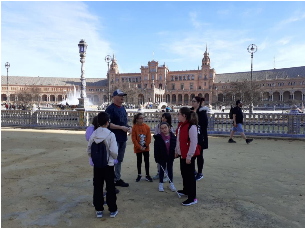
Ilustración 3. ESPERANDO AL GRUPO SCOUTS EN LA PLAZA DE ESPAÑA

Después de un suculento desayuno competente, tipo buffet en el que los chicos y chicas se ayudaron como grupo en las pequeñas dificultades que aparecían, nos dirigimos al parque de M a Luisa, donde durante la mañana del sábado pasamos realizando actividades conjuntas con un grupo de scouts de la misma edad que nuestros chicos.