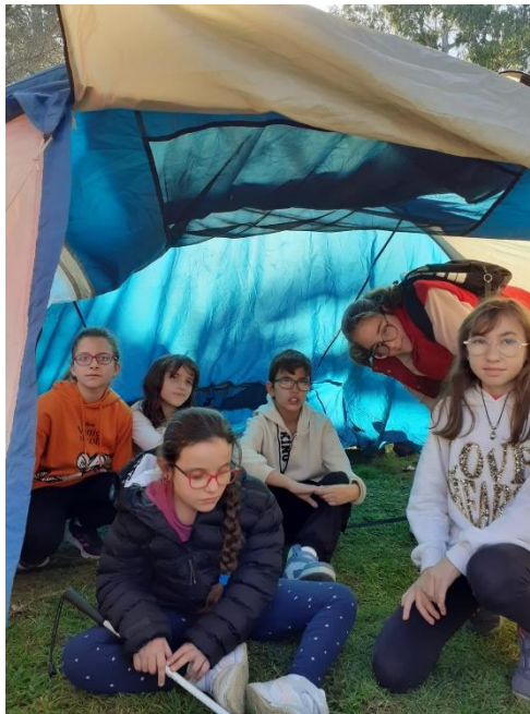
Ilustración 10. EL GRUPO DENTRO DE la TIENDA DE CAMPAÑA MONTADA EN EL PARQUE

En resumen, ha sido un magnífico fin de semana, dinámico y divertido, donde lo esencial se lo llevan puesto nuestros chicos y chicas afiliados, y que ahora deben proyectarlo en los próximos meses trabajando sus retos establecidos.