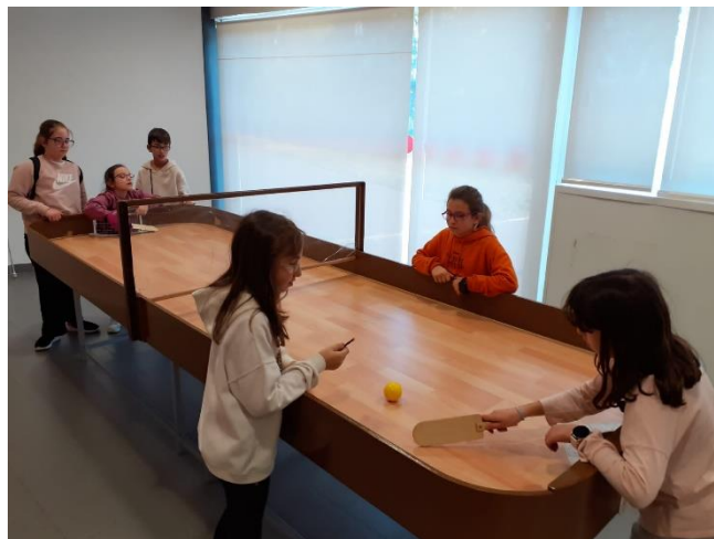
Ilustración 9. JUGANDO AL SHOW DOWN LA NOCHE DEL SÁBADO

Después de la cena, compartimos un ratito de tiempo de relax tras un agitado e intenso sábado.