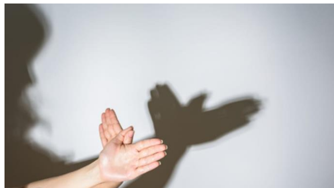
Pie de foto: sombra chinesca de un pájaro con las alas abiertas.

Más tarde, y con la ayuda de los profesionales de nuestro Equipo Educativo, junto a tres de nuestros alumnos/as de Educación Secundaria (estos últimos con interés de formarse en profesiones relacionadas con la infancia), los pequeños y sus familias participaron en un taller de manualidades, en el que se divertieron y pusieron en práctica sus destrezas para elaborar un palo de lluvia decorado.