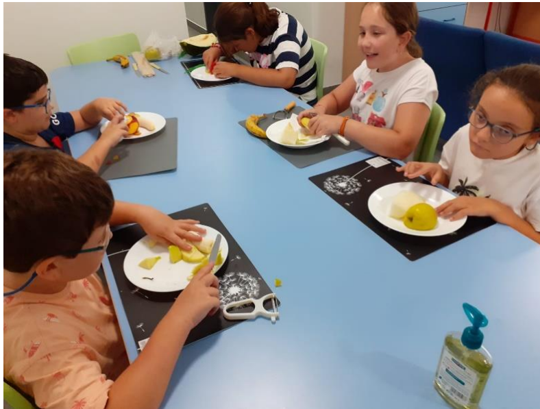
Ilustración 5. Cortando manzanas para elaborar brochetas de fruta. Alumnos de Primaria.