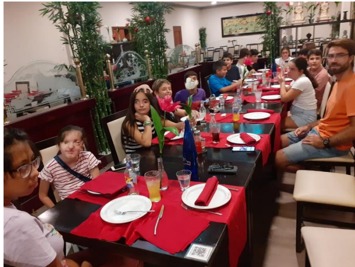
Ilustración 8. Cena de despedida en Restaurante Chino.