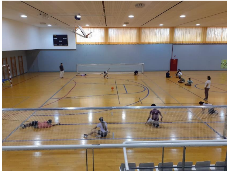
Ilustración 2. Jugando un partido del Campeonato de Goalball.

eléctricos, aprender a manejar diccionarios de inglés accesibles y repasar la fonética, así como adquirir estrategias para participar en actividades deportivas en sus centros escolares.