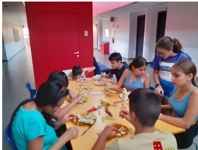
Ilustración 6. Alumnos de Secundaria preparando su brocheta de fruta en la hora de la merienda.

Ocio y aprendizaje en estos días en que realmente se lo han pasado estupendamente.