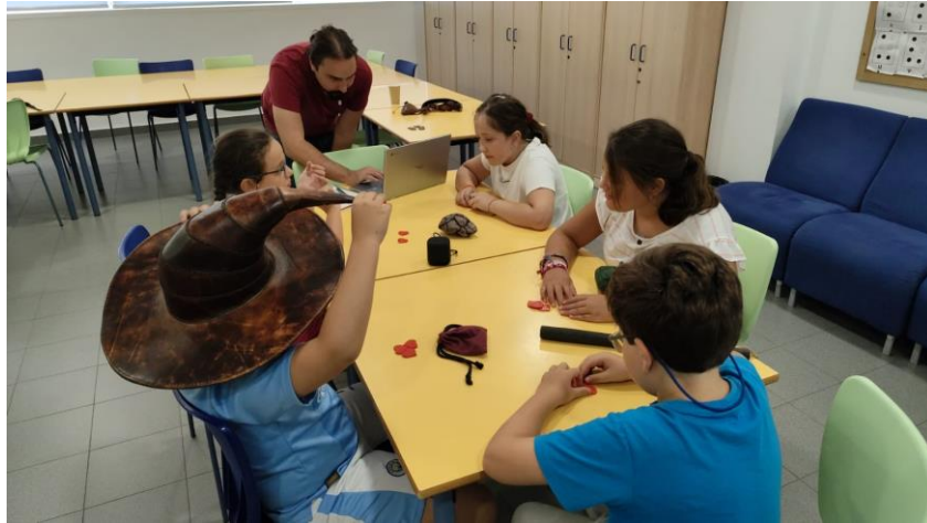
Ilustración 3. Juego de Rol del grupo de Primaria.