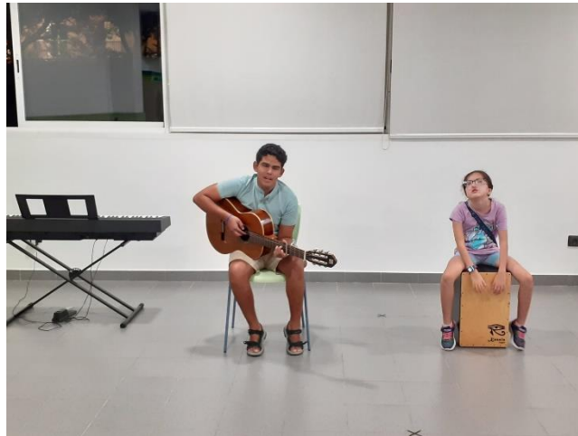
Ilustración 7. Un alumno toca la guitarra y una alumna el cajón flamenco en la velada artística.