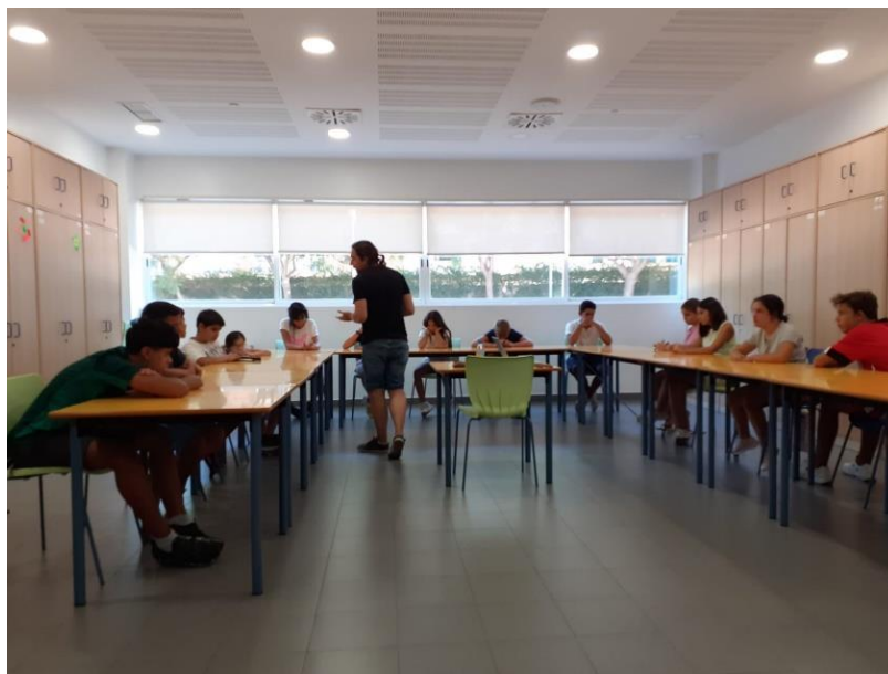
Ilustración 4. Juego de Rol del grupo de Secundaria.