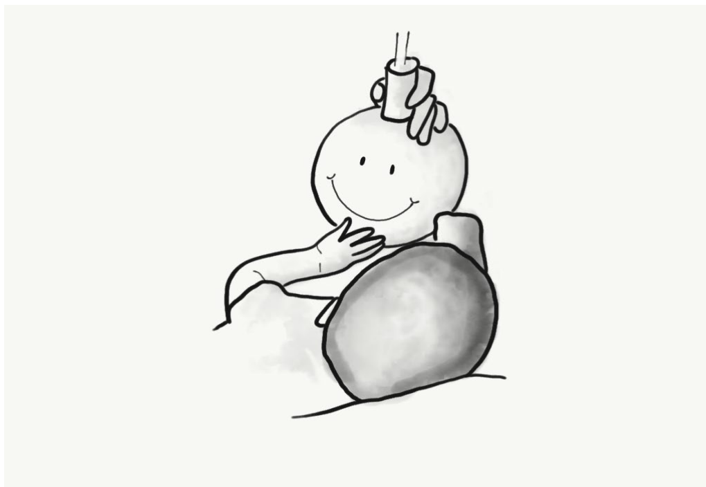
Ilustración 3. Estimulando la percepción visual

Estos servicios de Atención Temprana están formados por distintos profesionales especialistas, cada uno de ellos con unas funciones diferentes; fundamentalmente, son psicólogos, trabajadores sociales y maestros. Su acción conjunta permite dar la atención específica que necesitan los niños y sus familias.