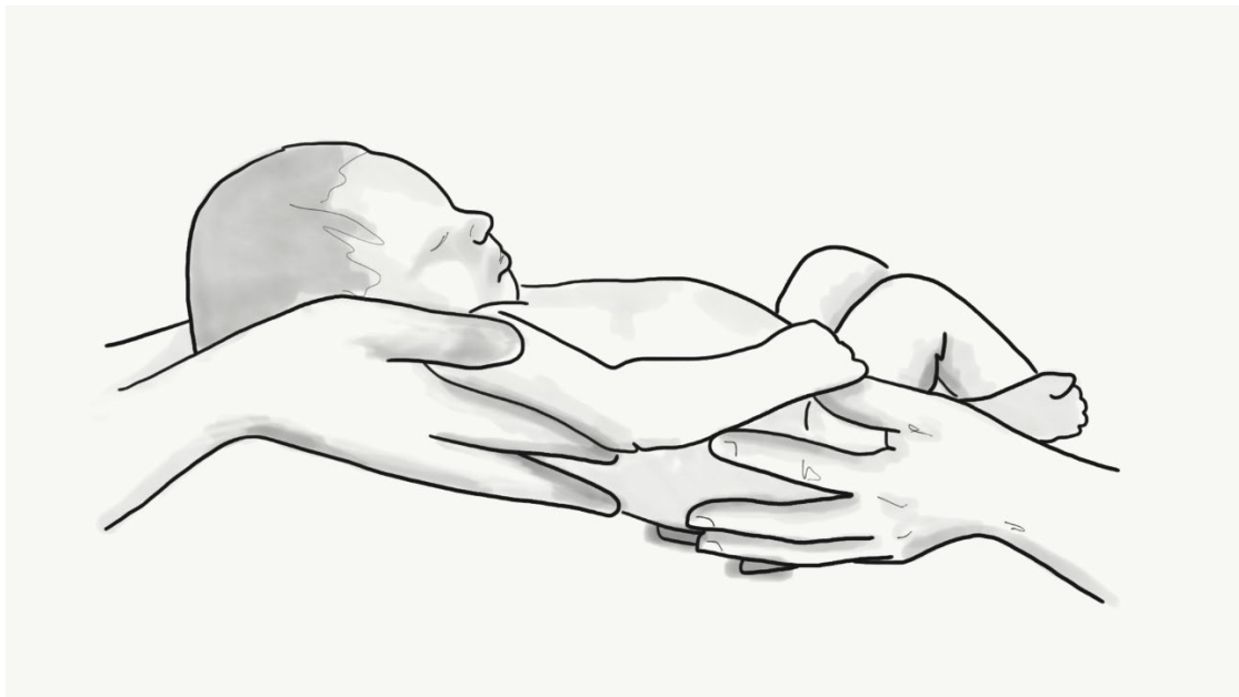
Ilustración 4. Crianza compartida

Juntos vamos a ayudar a tu hijo en su proceso de desarrollo para que alcance todos los retos que están por llegar: comunicar, jugar, comer solo, caminar, compartir con otros niños y seguir aprendiendo.