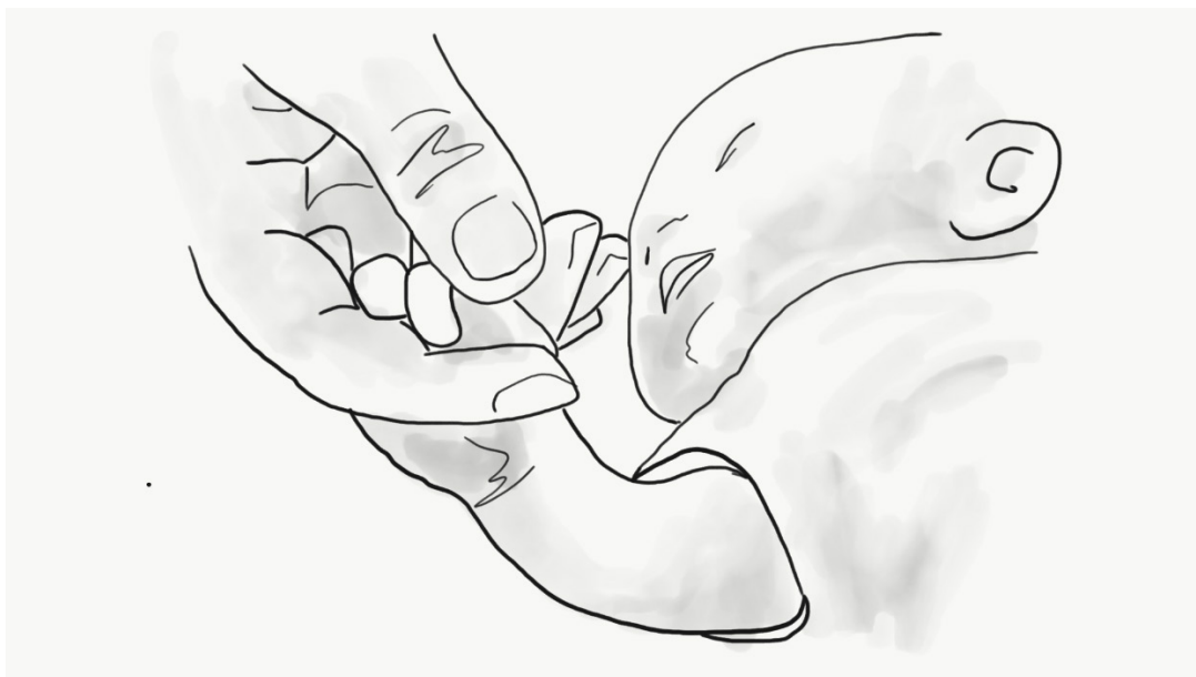
1. ilustrazioa. Lotura

Espero dugu zure bikotearen, zure gurasoen edo beste senide eta lagunaren sostengua izatea; zalantzarik gabe, horiek guztiak oso garrantzitsuak dira. Dena den, orain, pertsona hauen hurbiltasunaz eta asmo oneko gomendioez gain, honelako egoeretan esperientzia duen eta zure seme edo alabari gertatzen zaiona hobe ulertzen laguntzen dizuten erantzunak lortzeko laguntza ematen dizun pertsona bat behar duzula pentsatzen hasi zara.